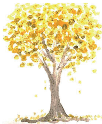
(pintura a base de açafrão e borra de café – por Gláucia Reis)